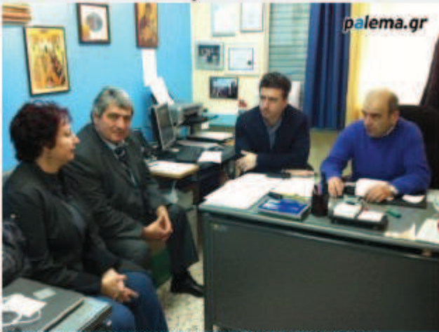
Στη φωτογραφία: Ο πρόεδρος της επιτροπής Μεσογειακών Αγώνων πάλης Γάλλος κ. Ντιντιέ Σαβιέρ στην Λάρισα

Σάββατο, 30 Μαρτίου 2012 09:49 Παναγιώτα Βασιλική