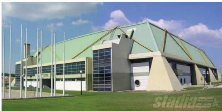
Gymnase couvert « Neapolis », Larissa

Les Collectivités, la Préfecture de Région, les Médias, les Acteurs économiques veulent faire de ce championnat de la Méditerranée un événement marquant et exceptionnel. Ce championnat de la Méditerranée qui réunira les pays du Bassin Méditerranéen est un lieu exceptionnel d'échange, de brassage de populations et d'interculturalités. Cet espace culturel et économique du bassin méditerranéen qui s'enrichit désormais de la démarche de l'euro méditerranée, peut devenir en y associant un sport olympique comme la lutte un vecteur et un accélérateur d'éducation par le sport, de développement de liens sociaux et de vecteur économique.